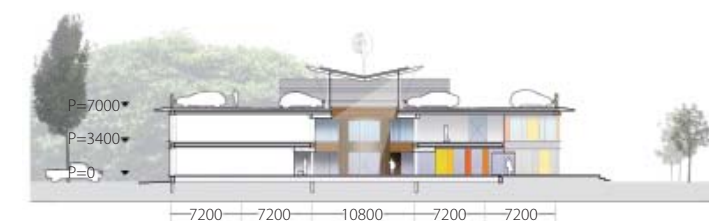
2 dwarsdoorsnede Gemeentehuis, zicht op raadzaal

Naast hergebruik is ook constructieve optimalisatie een van de belangrijkste pijlers onder een duurzaam gebouw. Met kleine ingrepen kunnen de onder- en bovenbouw vaak veel logischer op elkaar worden afgestemd, met enorme materiaalbesparingen tot gevolg. Daarvoor moet wel het totale ontwerp kritisch tegen