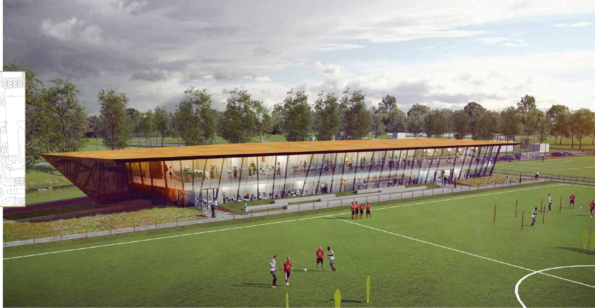
Schetsontwerp, overzicht. Ontwerp: MoederscheimMoonen Architects.