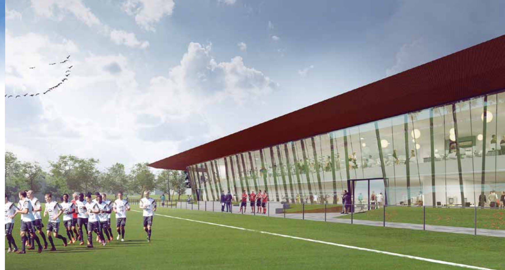
Schetsontwerp van de nieuwe trainingsaccommodatie van Feyenoord 1, die in 2018 in gebruik genomen moet worden. Ontwerp: MoederscheimMoonen Architects.

De bouw van een nieuw trainingscomplex heeft lange tijd gelijk gelopen met de ontwikkeling van een nieuw stadion, met name in financieel opzicht. 'Feyenoord was bezig met een slag om de schulden weg te werken, waardoor we qua financiering altijd moesten meeliften met het hele stadiontraject (Het Nieuwe Stadion, red.),' zegt Gudde. 'Toen HNS en later de plannen voor de verbouwing van de huidige Kuip sneuvelden, gingen ook de plannen voor een nieuw trainingscomplex overboord. In die situatie is pas verandering gekomen nadat we als club een positief eigen vermogen hadden gecreëerd. In het voorjaar van 2015 hebben we gezegd: nu gaan we zelfstandig aan de slag met een trainingsaccommodatie en laten we ons niet meer leiden door de stadionontwikkeling.'