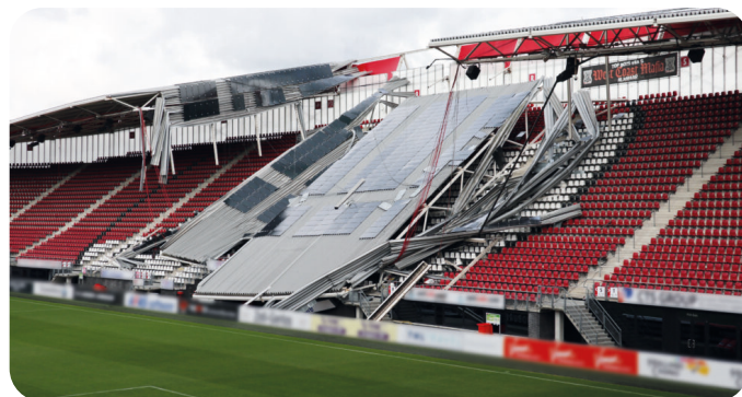
Instorting dak AZ stadion. Met keuringen zijn instortingen te voorkomen.