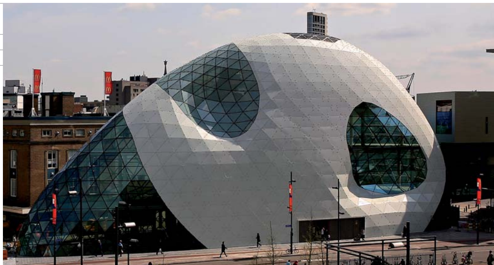
De Blob is het 'entreegebouw' voor het 18 Septemberplein in het centrum van Eindhoven.

Glasleverancier Blob: Flachglas Wernberg, Wernberg