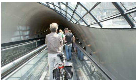
De toegang naar de fietsenkelders onder het plein heeft een kap met gebogen en gelamineerd glas.

Liefhebbers van vrije vormen kunnen zich op het plein een eigen mening vormen over de twee mogelijkheden: enerzijds een gesegmenteerde vorm die met vlakke glazen platen is ingevuld (de Blob) en anderzijds een gekromde vorm die met gebogen glas is ingevuld (de tunnelkappen). De panelen van gebogen glas in de tunnelkappen zijn gefabriceerd en geleverd