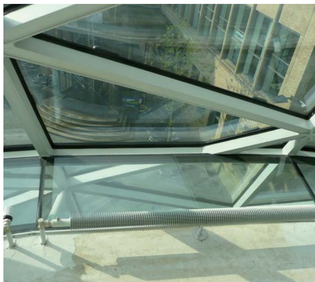
Een beloopbare glasstrook vormt de overgang tussen de betonnen vloer en de gevel.