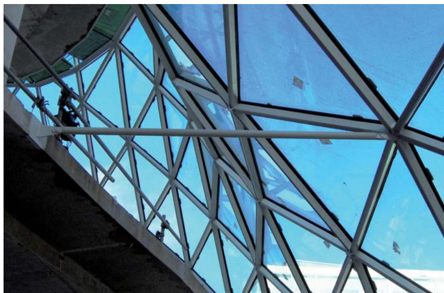
De gevel is met een pendelstaaf aan de vloerrand bevestigd om de windkracht over te dragen.

De Blob-vormige buitenschil draagt zichzelf. Constructeur Remko Wiltjer van IMd uit Rotterdam legt uit: 'De Blob-vorm heeft ook constructieve voordelen. Je kunt het zien als een eierschaal. Die draagt zichzelf vrij makkelijk, omdat het een gebogen bolle vorm >>