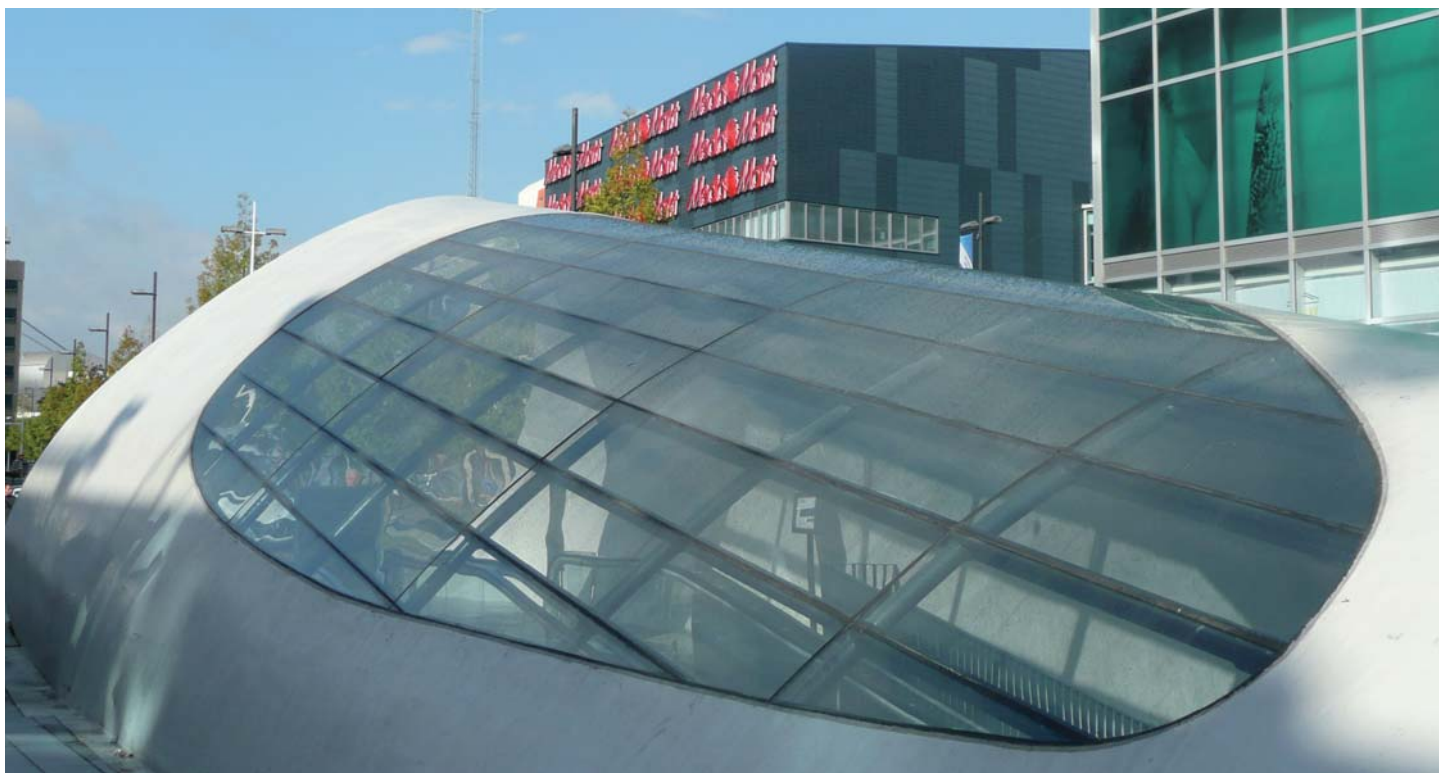
Het gebogen glas loopt naadloos over in het oppervlak van de kap.

door Tetterode Glas uit Voorthuizen. Het gaat om enkel gekromde ruiten die bestaan uit 55.1 gelamineerd glas. Naast de gebogen ruiten leverde Tetterode de langwerpige glazen tegels die in de bestrating van het plein opgenomen zijn. Die glastegels worden 's avonds van onderaf verlicht. <