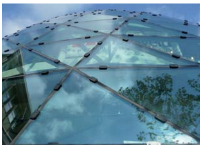
Het glas is aan de buitenzijde met aluminium plaatjes geborgd.

De draagconstructie voor de verdiepingvloeren staat op zichzelf. Wiltjer vertelt: 'De verdiepingvloeren lopen niet allemaal door tot aan de gevel. Daardoor was het lastig om de gevel erop te laten rusten. Omgekeerd was het ook niet aantrekkelijk om de vloeren door de gevel te laten dragen; want dan had alles veel zwaarder uitgevoerd moeten worden. Daarom zijn twee aparte draagconstructies ontworpen, waarbij kolommen alle verdiepingvloeren dragen.' Om windkrachten op te nemen, is de gevel met pendelstaven aan de vloeren gekoppeld. Maar de pendelstaven zorgen er ook voor dat het gewicht van de vloeren niet op de gevelconstructie gaat drukken. De pendel-