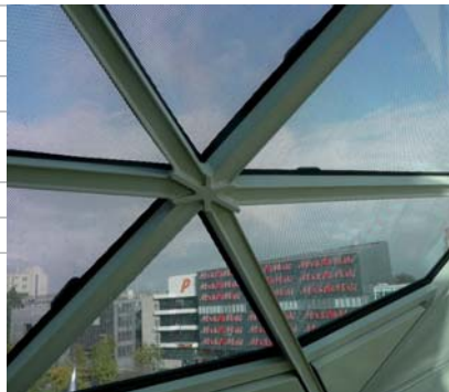
Een deel van de ruiten heeft een zeefdruk gekregen.

staven geven ook de bewegingsruimte voor het uitzetten en inkrimpen van de gevel door temperatuurverschillen. De gevel is niet gedilateerd omdat dat de membraanwerking teniet zou doen.