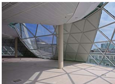
Vanwege de vorm van het gebouw en de afwisseling tussen glas en dichte panelen ontstaan diverse interieurbeelden.

Glas met zeefdruk: buitenruit Planilux 8 mm met op positie 2 frit stippen 4 mm diameter en dichtheid 33%; 16 mm Argongevulde spouw; binnenruit gelamineerd planilux 5 mm, 4 pvb, planilux 5 mm. Saint-Gobain Glass / Flachglas Wernberg