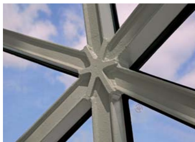
Vanwege de vorm van de gevel zijn alle knopen uniek.

Later ontstond discussie over de metalen plaatjes die het glas aan de buitenzijde borgen. De meningen waren ver- >>