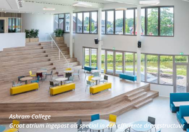
Ashram College Groot atrium ingepast als special in een efficiënte draagstructuur