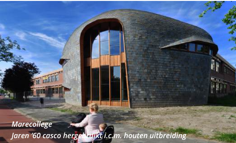
Marecollege Jaren '60 casco hergebruikt i.c.m. houten uitbreiding

Bij het realiseren van een nieuw schoolgebouw is geld een belangrijke factor. Met creatieve en slimme oplossingen zorgen voor een kostenefficiënt gebouw, waarbij het budget zo doelmatig mogelijk wordt ingezet. Zo ontstaat er ruimte voor bijzondere kenmerken en wordt het haalbaar om met de beschikbare middelen een gebouw te ontwikkelen dat indruk maakt. Op leerlingen, medewerkers en omwonenden.