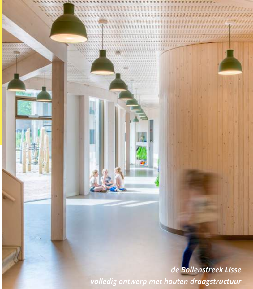
de Bollenstreek Lisse volledig ontwerp met houten draagstructuur